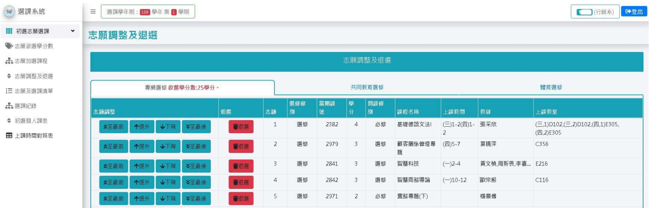
圖 8-志願調整及退選