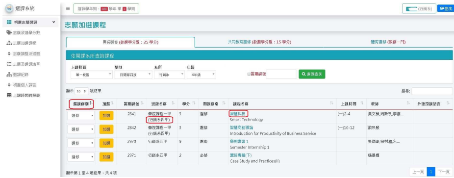
圖 6-課程查詢、當期課號、選課修別欄位註記